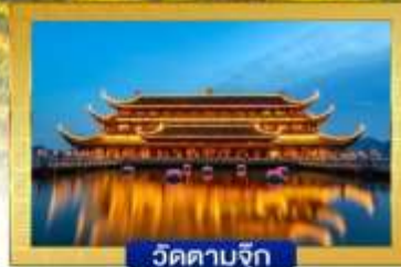
วัดตามจุก