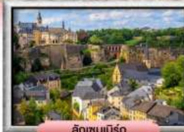
ลักเซมเบิร์ก