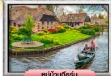
หมู่บ้านทีรูร์น

เมนู พิเศษ! หอยแมลงภู่อบไวน์ขาว, ส่งเรือหลังคากระจก