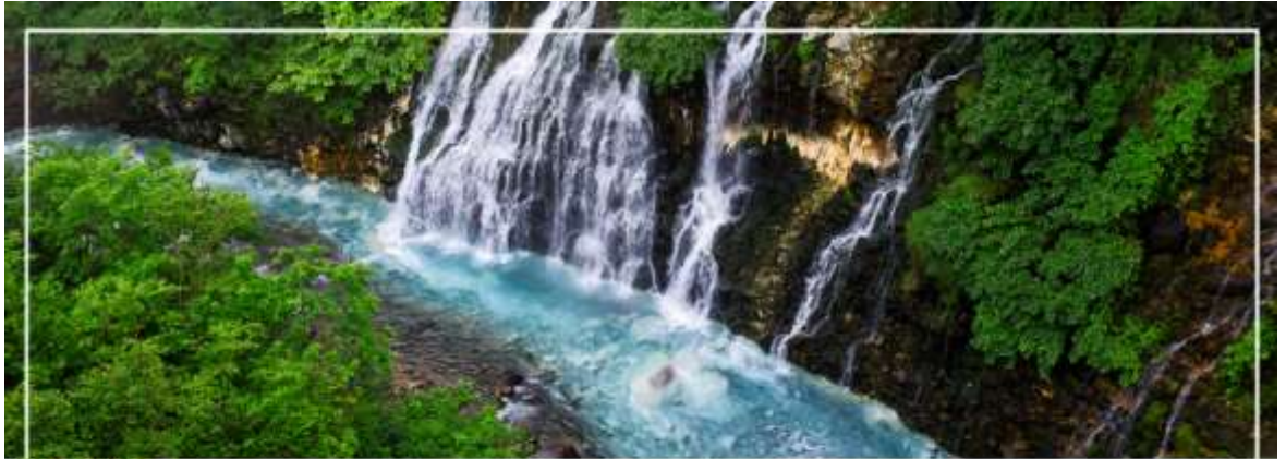
SHIRAHIGE WATERFALL น้ำตกชิราฮิเกะ

เช้า รับประทานอาหารเช้า ณ ห้องอาหารของโรงแรม (7) นำท่านเดินทางสู่ เมืองบิเอะ (Biei) (ใช้เวลาเดินทางประมาณ 1.10 ชั่วโมง) เมืองเล็ก ๆ ล้อมรอบ