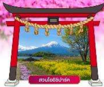
สวนโออิชิปาร์ค