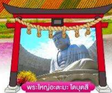
พระใหญ่อะตะมะ โดบุตสึ