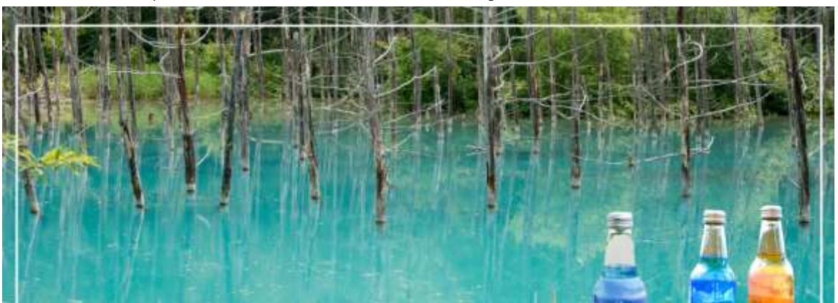
BLUE POND สระอะโออิเคะ

จากนั้นนำท่านชม สระอะโออิเคะ (Aoiike) หรือที่เรารู้จักกันอีกชื่อหนึ่งว่า "สระน้ำสีฟ้า (Blue Pond)" ห่างจากเทือกเขา Tokachi ประมาณ 2.5 กิโลเมตร นับเป็นแหล่งท่องเที่ยวที่เหมาะสมกับนักท่องเที่ยวสายสงบส่วนมากคนที่มาเที่ยวก็จะเป็นนักท่องเที่ยวต่างชาติ สาเหตุที่มีชื่อว่า สระอะโออิเคะ (Aoiike) หรือสระน้ำสีฟ้า (Blue Pond) นั้นก็เพราะว่ามีการตั้งชื่อตามสีของน้ำที่เกิดจากแร่ธาตุตามธรรมชาตินั่นเองโดยน้ำในส่วนนี้เพิ่งเกิดขึ้นจากการกันเขื่อนเพื่อป้องกันไม่ให้โคลนภูเขาไฟ Tokachi ที่ปะทุขึ้นเมื่อปี ค.ศ.1988 ที่ได้ไหลทะลักเข้าสู่เมืองนั่นเอง