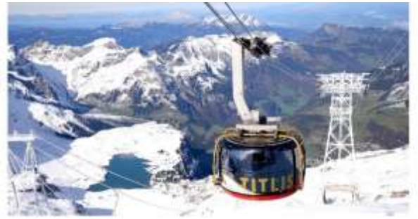
Highlight ! กระเช้าโรตเตอร์เป็นกระเช้าไฟฟ้าหมุนได้ 360 องศา แห่งแรกของโลก จุผู้โดยสารได้ 80 คน ใช้เวลาประมาณ 5 นาที ในการขึ้นสู่ยอดเขา

เช้า ๑๐ รับประทานอาหารเช้า ณ โรงแรม (มือที่5) จากนั้นนำท่านเดินทางสู่ เมืองแองเกิลเบอร์ก (Engelberg) (ระยะทาง 36ก.ม. / 1 ชม.) หมู่บ้านเล็กๆ ตั้งอยู่เชิงเขา ที่ล้อมด้วยเทือกเขาแอลป์ เป็นที่ตั้งของ สถานีขึ้นกิตลิส จากนั้นนำท่านนั่งกระเช้าโรตเตอร์เพื่อเดินทางขึ้นสู่ ยอดเขากิตลิส (Titlis) (ค่าขึ้นกระเช้าไป-กลับ รวมในค่าทัวร์แล้ว) ให้ท่านจะได้สัมผัสกับกระเช้าทรงกลมที่เรียกว่า โรตเตอร์ เคเบิลคาร์ ในขณะที่เคลื่อนที่ขึ้นไปเรื่อยๆ ท่านจะเห็น เทือกเขาแอลป์ ธารน้ำแข็ง และทะเลสาบเบื้องล่าง ในวันที่อากาศแจ่มใส คุณสามารถมองเห็นยอดเขา Jungfrau joch และ Eiger ได้อีกด้วย