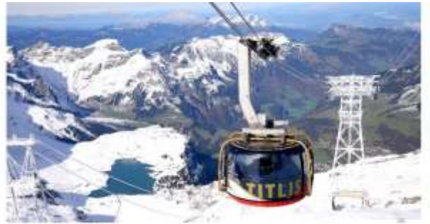
Highlight ! กระเช้าโรแตรเป็นกระเช้าไฟฟ้าหนักได้ 360 องศา แห่งแรกของโลก จุผู้โดยสารได้ 80 คน ใช้เวลาประมาณ 5 นาที ในการขึ้นสู่ยอดเขา

จากนั้นนำท่านเดินทางสู่ เมืองแองเกลเบิร์ก (Engelberg) (ระยะทาง 36ก.ม. / 1 ชม.) หมู่บ้านเล็กๆ ตั้งอยู่เชิงเขา ที่ล้อมด้วยเทือกเขาแอลป์ เป็นที่ตั้งของสถานีขึ้นคิตลิส จากนั้นนำท่านนั่งกระเช้าโรแตรเพื่อเดินทางขึ้นสู่ ยอดเขาคิตลิส (Titlis) (ค่าขึ้นกระเช้าไป-กลับ รวมในค่าทัวร์แล้ว) ให้ท่านจะได้สัมผัสกับกระเช้าทรงกลมที่เรียกว่า โรแตร เคเบิลคาร์ ในขณะที่เคลื่อนที่ขึ้นไปเรื่อยๆ ท่านจะเห็น เทือกเขาแอลป์ ธารน้ำแข็ง และทะเลสาบเบื้องล่าง ในวันที่อากาศแจ่มใส คุณสามารถมองเห็นยอดเขา Jungfrau joch และ Eiger ได้อีกด้วย