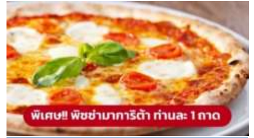
พิเศษ!! พิซซ่ามาการิตต้า ท่านละ 1 ถาด

เป็นมหาวิหารที่ใหญ่เป็นอันดับสองของโลกและรูปแบบการสร้างสถาปัตยกรรมแบบกอธิคที่ใหญ่ที่สุดในโลก มียอดแหลมบนหลังคา มากถึง 135 ยอด จนได้รับฉายาว่า "วิหารเม่น" บนยอดที่สูงที่สุดมีรูปปั้นทองขนาด 4 เมตร ของพระแม่มาดอนน่า