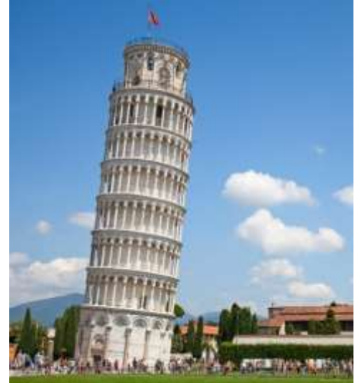
Highlight ! หอเอนปีซ่าเคยเป็นสถานที่กาลิเลโอมาพิสูจน์เรื่องแรงโน้มถ่วงของโลกและการตกของวัตถุ