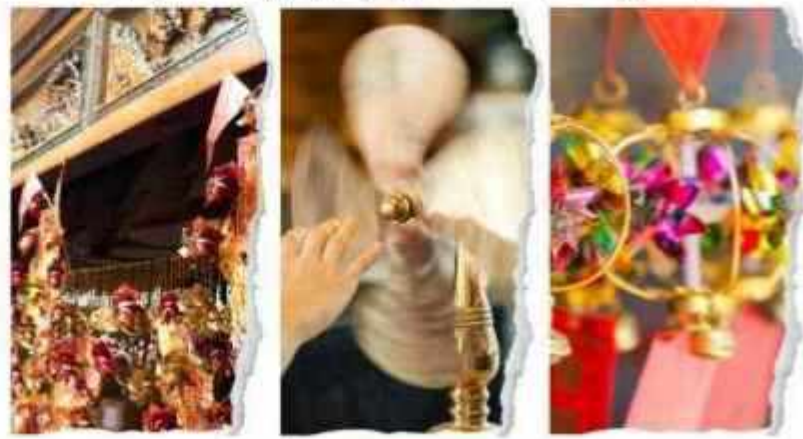
วัดแซกงหมิว

นำท่านขอพรเพื่อเป็นสิริมงคล วัดแห่งนี้เป็นวัดที่คน ฮ่องกงให้การเคารพนับถือเป็นอย่างมาก เป็นวัดเก่าแก่ และมีชื่อเสียงที่สุดวัดหนึ่งของฮ่องกง เป็น 1 ในวัดของ ฮ่องกงที่ทุกท่านห้ามพลาดเลยทีเดีย