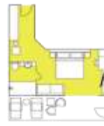
CATEGORY B Balcony Suite (6) app. 32 sqm, incl. Balcony