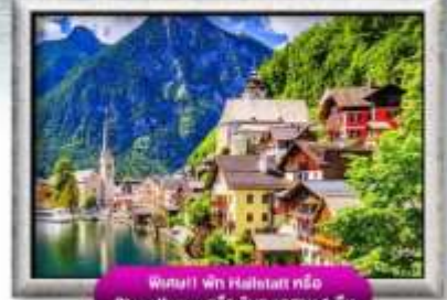
พิกนิก พิก Hahntast หรือ St. Wolfgang หรือ Sunnensaan 1 คืน

พิเศษ!! ลิ้มลองเมนูประจำชาติ ทั้ง 5 ประเทศ!!!