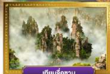
เทียนจื่อซาน