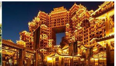
ตึก 72 ชั้น

*ทางบริษัทฯ ขอสงวนสิทธิ์ในการสลับโปรแกรมทัวร์ตามความเหมาะสมขึ้นอยู่กับสถานการณ์หน้างาน โดยคำนึงถึงผลประโยชน์ของลูกค้าเป็นสำคัญ