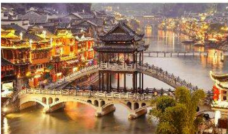
เมืองเฟิ่งหวง