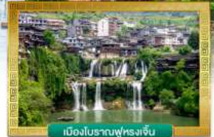
เมืองโบราณฟู่หลงเจิน