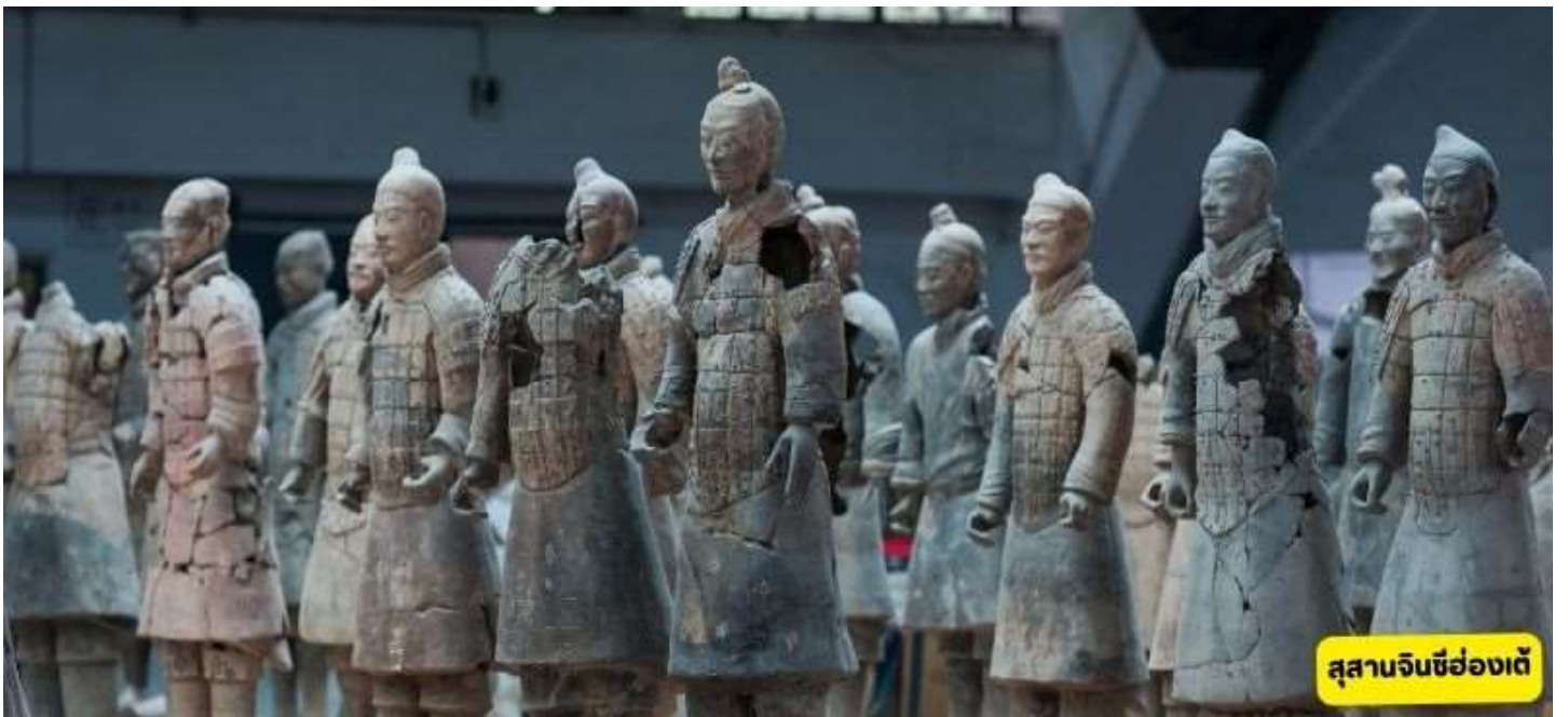
สุสานจินซีฮ่องเต้

สุสานจินซีฮ่องเต้ - วัดต้าฉือเอิน - เจดีย์ห่านป่าใหญ่ - ถนนต้าถังเมืองที่ไม่เคยหลับไหล