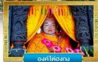
องค์ไตองกง