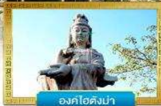
องค์ไร่ดงม้า