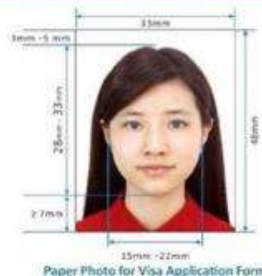
Paper Photo for Visa Application Form