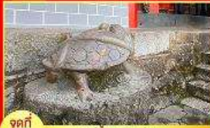
จุดที่ 2 รูปปั้นงูพันเต่า ข้าง ศาลเจ้าพ่อเสือ