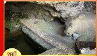
จุดที่ 3 บ่อน้ำศักดิ์สิทธิ์วัดกตัญญู