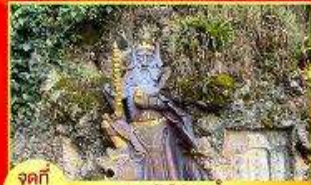
จุดที่ 1 เทพเจ้าไฉ่ซิงเอี้ย หรือ เทพเจ้าแห่งโชคลาภ