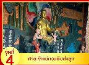
จุดที่ 4 ศาลเจ้าแม่กวนอิมส่งลูก