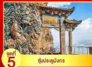
จุดที่ 5 ชุมประตุมังกร

จุดที่หนึ่ง เทพเจ้าไฉ่ซิงเอี้ย หรือ เทพเจ้าแห่งโชคลาภ วิธีการขอพร >> นำมือไปจับก้อนทองแล้วอธิษฐานขอพร จากนั้นกวักนำมาใส่กระเป๋าเงินของเรา เชื่อว่าจะทำให้มีเงินทองไหลมาเทมาเพิ่มพูนไม่ขาดสาย