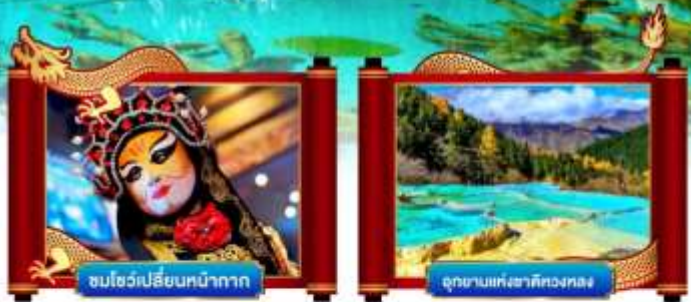
ชมโชว์เปลี่ยนหน้ากาก