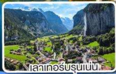
เลาเทอรับรุเนน